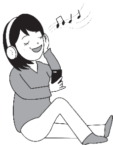
おんがく ongaku 音楽