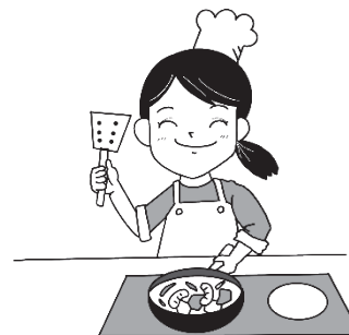
りょうり ryoori 料理