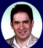
レオニード・ボムシュテイン Леонид Бомштейн