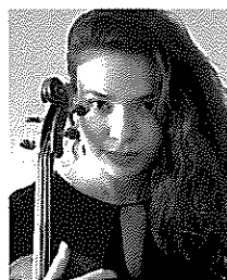
アストヒク・サルダリヤン (ヴァイオリン) Астхик Сардарян

1967年レニングラード(現在の Санктペテルブルグ)に生まれる。1996年にグネーシン音楽大学を卒業後、スタニスラフスキー&ミネロヴィチ・ダンチェンコ国立モスクワ音楽劇場での活動を経て、1998年ポリショイ劇場のソリストとなる。アイルランド、フランス、ドイツ、アメリカ、スイスを始め、世界中のオペラ音楽祭へ出演し活発な活動を続ける。現在は、演奏活動を続ける傍ら、母校であるグネーシン音楽大学で後進の指導にあたっている。