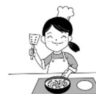
ベトナムのりょうり betonamu no ryoori 料理