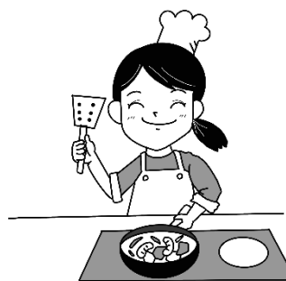
りょうり ryoori 料理