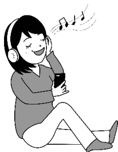
おんがく ongaku 音楽