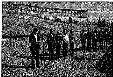
植林会場での式典